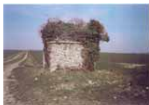
Avant la rénovation

C'est où ?... C'est à la mairie de ton domicile avec ta pièce d'identité, le livret de famille de tes parents et un justificatif de domicile. C'est pour quoi faire ?... C'est pour passer ton BEP, ton BAC... Inscrire à la conduite accompagnée... ...et faire ta JAPD.