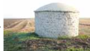
Après la rénovation en 2007

Cet abri de cantonnier fut construit vers les années 1860 pour servir d'abri au cantonnier en cas de mauvais temps. Il disposait d'une cheminée qui permettait au cantonnier de se chauffer et de prendre son repas de midi. Cet abri tombait en ruine et la municipalité précédente avec le soutien du PNR a décidé de le rénover.